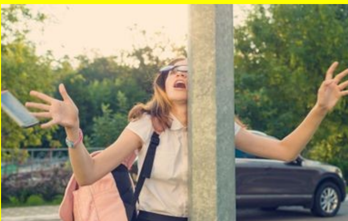
Une Mombie, vive les smartphones